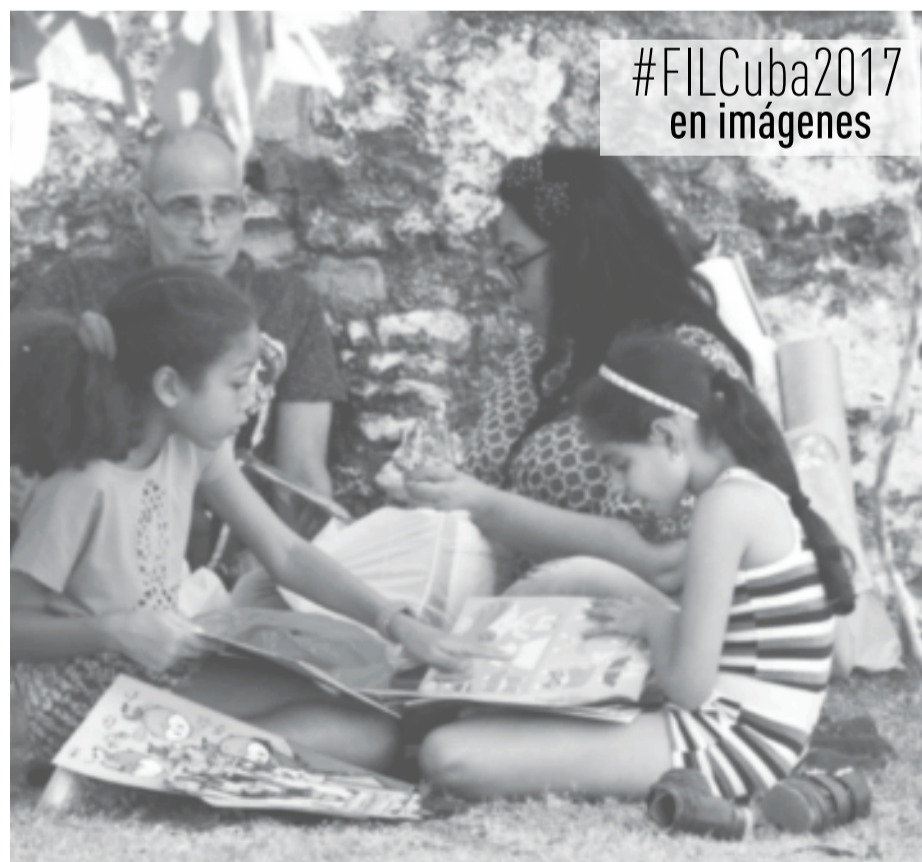
#FILCuba2017 en imágenes