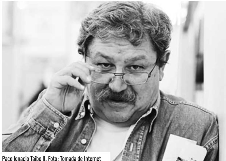
Paco Ignacio Taibo II.

—La historia es fundamental, dice de dónde venimos. El problema está en que cuando la manejas de forma rutinaria, formal, se vuelve fría y deja