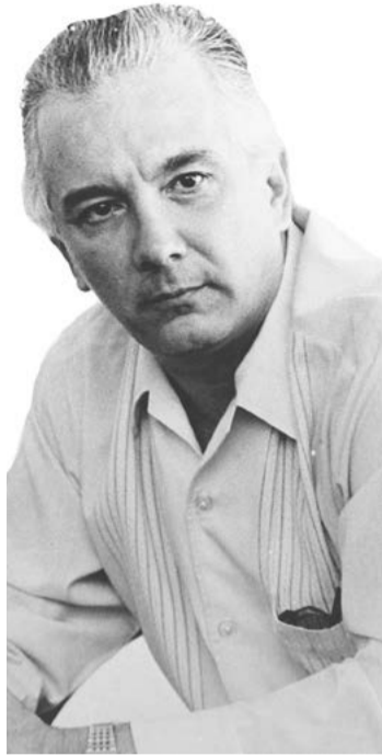
Armando Hart.

En sus papeles, esos que con celo se conservan, está lo que modestamente para bien ha hecho en favor de la justicia, la educación y la cultura. Su continuo