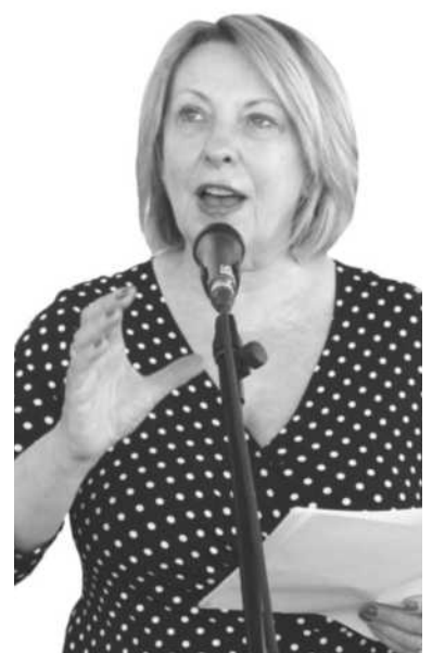
Christine St. Pierre, ministra de Relaciones Internacionales y de la Francofonía de Québec.