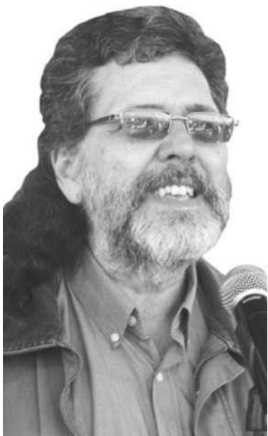
Abel Prieto Jiménez, ministro de Cultura de Cuba.

El programa arrancó con el encuentro Cuba-Québec, el calor y el frío , sobre la escritora Maya Ombasi. A renglón seguido sesionaron varios paneles sobre la esencia de Québec como tierra de poetas, la vida cotidiana a través de los libros, acerca de los escritores noveles y la influencia de la historia de Cuba en la narrativa de esa provincia.