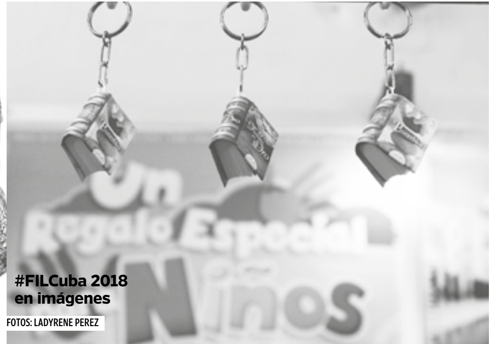
#FILCuba 2018 en imágenes